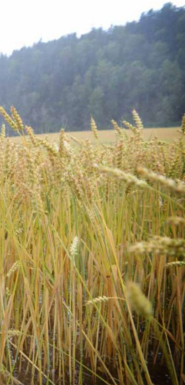
på to dager.