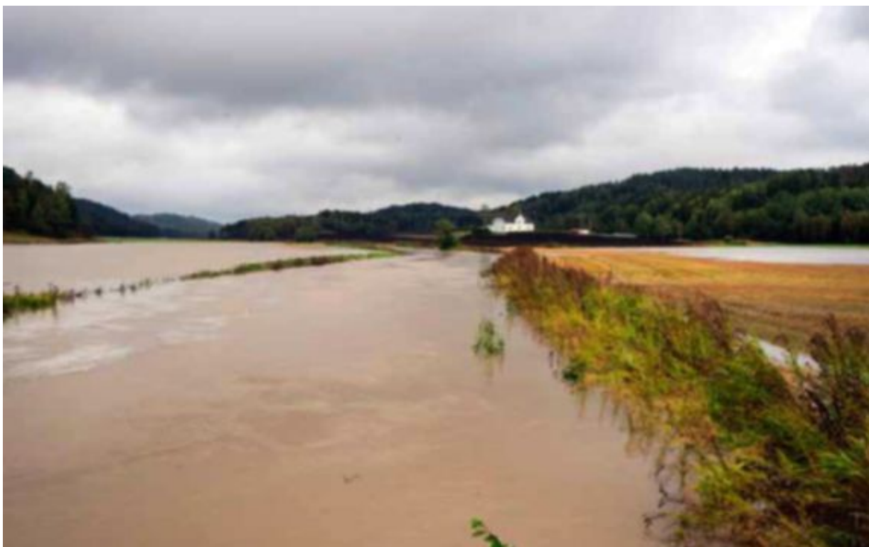
Normalt: Det blir flere hendelser med ekstremnedbør og regnflommer. Det rammer jordbrukere fra vest til øst.