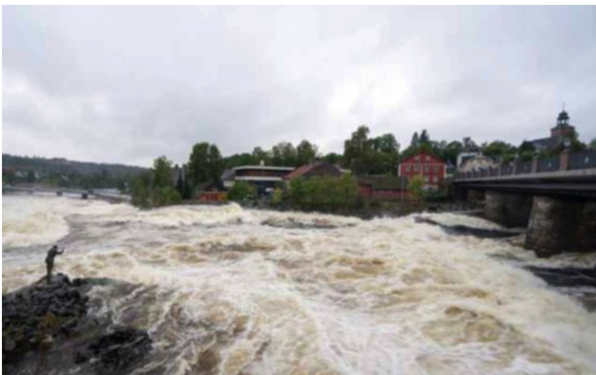
Vakkert skue: I Kongsberg snor elven seg som et vakker skue gjennom byen. Den høye vannføringen har ført til at elven har fått mye oppmerksomhet av både lokale og tilreisende.